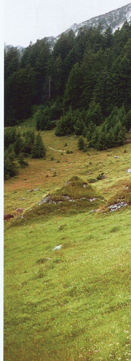
Bremshöcker in Amden

In der Zeit vom 17. bis zum 19. Jahrhundert nahm die Bevölkerung im Gebiet der Alpen stark zu. Immer mehr und exponiertere Gebiete in den Bergen mussten zur Sicherung der Existenz besiedelt und als Kulturland nutzbar gemacht werden. Zwar versuchten die Menschen, ihre Bauten soweit als möglich an Orten zu platzieren, an denen keine Gefährdung durch Naturgewalten zu erwarten war. Zunehmend wurden jedoch die schützenden Waldflächen abgeholzt, um Holz als Brennmaterial und Rohstoff zum Verkauf zu gewinnen. Als Folge davon waren Gebäude, Weiden und Felder von Lawinen, Steinschlag und Hochwasser