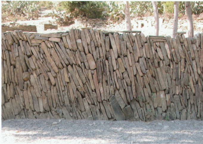
Schutzmauern in Äthiopien

gefährdet. Trotz diesen schwierigen Bedingungen hat man versucht, sich möglichst gut vor den Naturgefahren zu schützen. Mit einfachsten Werkzeugen und dem jeweils direkt am Ort abgebauten, dauerhaften Gestein wurden Schutzbauwerke errichtet, deren Grösse und Konstruktion erstaunlich ist.