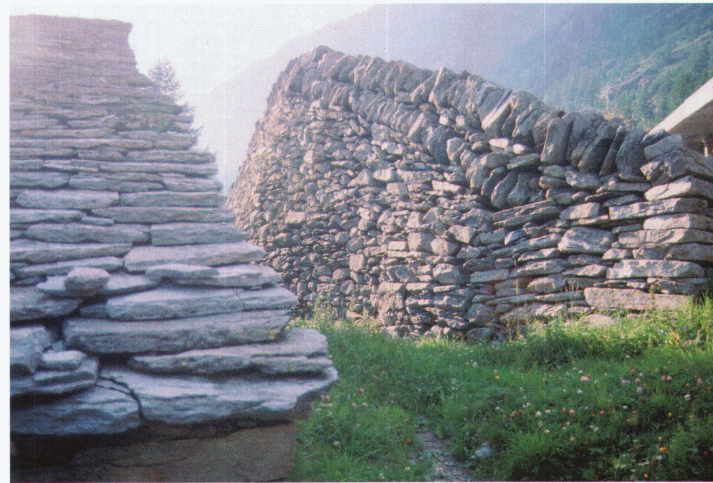
Oben: Spaldecke am Simplon. Unten: Lawinen-Terrassen auf der Alp Faldum