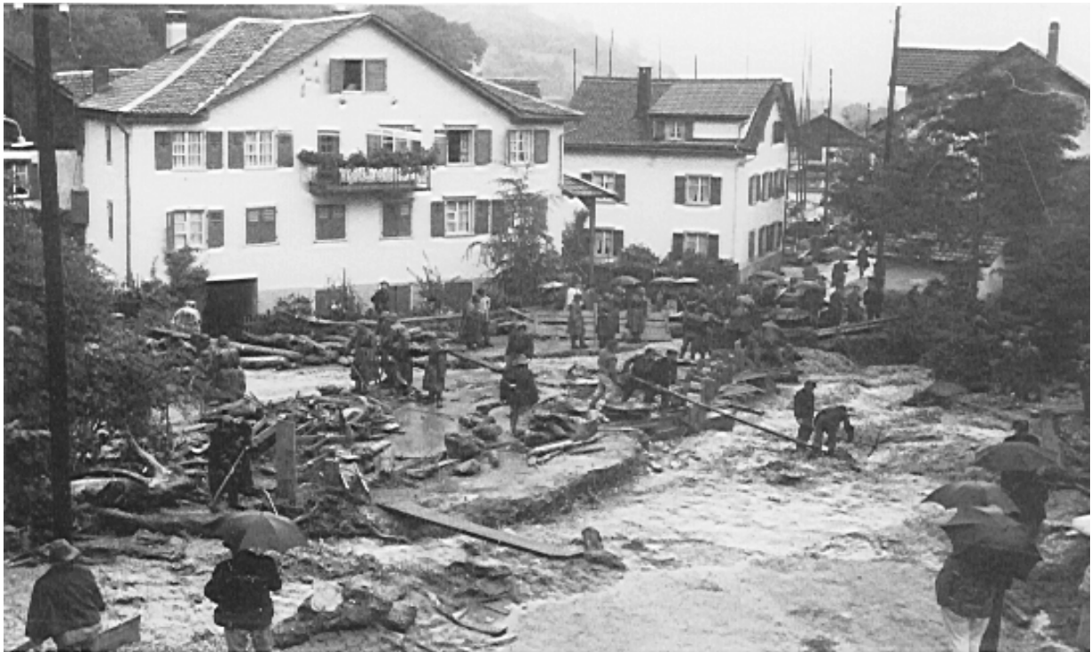
Abbildung 4: Aufräumarbeiten am aufgefüllten Bachbett bei der Bädersbrücke

der Brücke ein neues Bachbett zu graben und das Wasser anschliessend wieder teilweise ins alte Bachbett zurückzuführen (Abbildung 4). (Interview Lorenz Krättli)