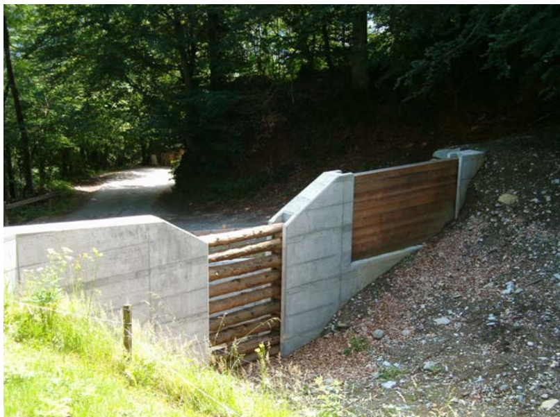
Abbildung 3: Geschiebesperre mit Durchlassöffnung, Flumisbach (Untervaz)

Einen gleichmässig und somit kontrollierten Geschiebetrieb wird durch ein geordnetes Bachbett erreicht. Um zu verhindern, dass das Geschiebe bei Muren bis ins Siedlungsgebiet vorstösst, können Geschiebesperren (Abbildung 3) errichtet werden. Dabei handelt es sich um massive Rückhaltevorrückungen aus Stein-, Betonmauern oder anderen robusten Materialien, welche das Geschiebe zur Ablagerung bringen (Dimitrov, 1966: 524). Damit das Wasser trotzdem abfliessen kann und um eine übermässige Aufstauung zu verhindern, wird die Geschiebesperre in der Mitte mit einer