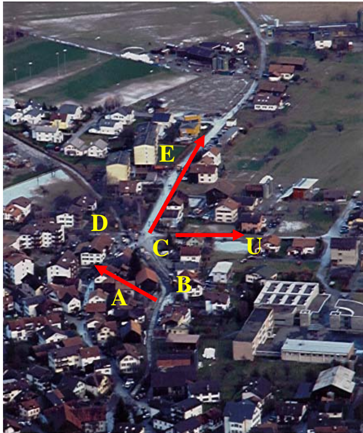
Abbildung 5: Luftaufnahme Unterdorf am 17. November 2002

Nach rechts fliesst es in Richtung Cosenzstrasse (U) und geradeaus hinunter nach Gravis (E), wo es den Fussballplatz und Landwirtschaftsgebiet überschwemmt. Durch das weitere Aufstauen des Bachbettes mit Geschiebematerial, fliesst das Wasser zunehmend weiter oben über die Ufer. Zur rechten Seite wird die Strasse im Giessacker (B) überflutet und es lagern sich grosse Mengen Geschiebe ab. Auf der linken Seite dringt das Wasser durch eine Parterrewohnung und fliesst Richtung Sala (A) und Pardiel (D). Wasser, Schlamm, Kies und Holz bleiben auf den Strassen und in den Gärten, Kellern und Erdgeschossen der