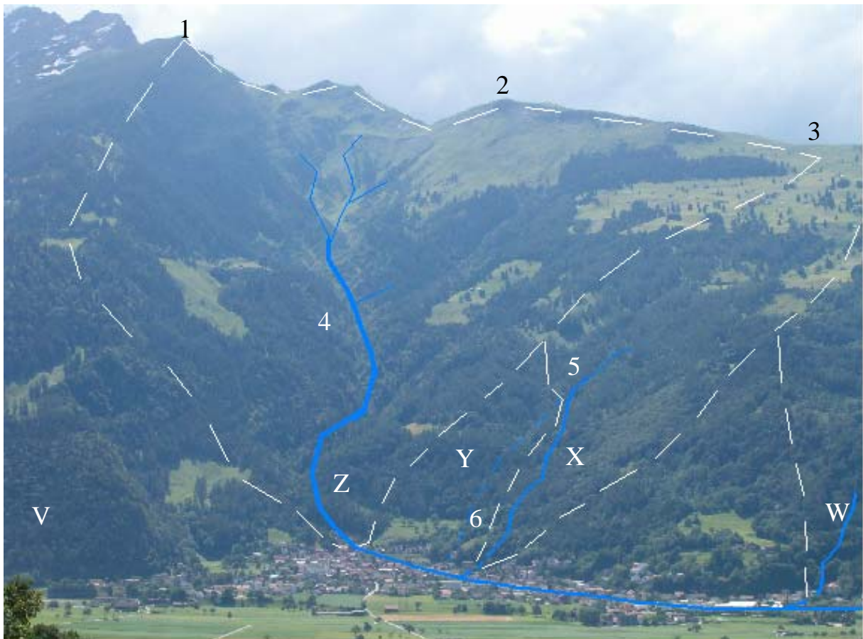
Abbildung 1: Ansicht auf Untervaz mit den verschiedenen Bächen (blau) und ihren Einzugsgebieten (weiss gestrichelt)

Die Gemeinde Untervaz mit einer Fläche von 2'767 Hektaren befindet sich im Kanton Graubünden, rund 10 Kilometer nördlich von Chur. Das Dorf liegt auf einer Höhe von 565 Metern über Meer auf einem Schuttkegel (www.graubünden-online.ch). Dieser entstand im Laufe der Zeit durch Ablagerungen des Cosenzbaches (Z) (Abbildung 1) der das Dorf auf einer Länge von knapp einem Kilometer in nordöstlicher Richtung durchquert. Anschliessend mündet er etwa 1,5 Kilometer nördlich von Untervaz in den Rhein.